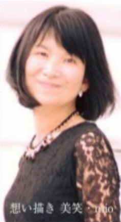
想い描き 美笑 (mio)