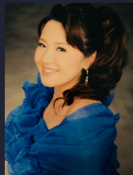
大矢 朋佳 ソプラノ