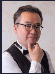
平尾 弘之 テノール