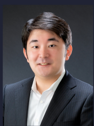
大高 賢人 テノール