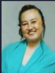
中村 佳世 ソプラノ