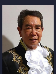
越川 洋一 バリトン