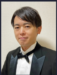
横西 久幸 テノール